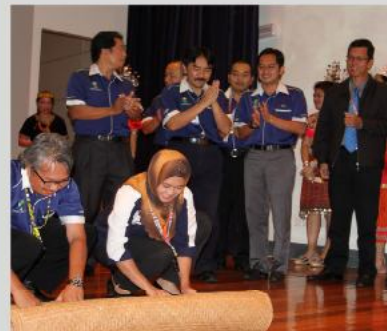
Timbalan Pengarah Yayasan Sarawak bersama-sama Pengerusi Kelab Yayasan Sarawak melakukan upacara "ngiling Tikai" sebagai tanda simbolik penutup sambutan Gawai Dayak.