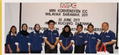
Kumpulan YSK2 mengabadikan kenangan bergambar bersama-sama setelah selesai membuat persembahan.