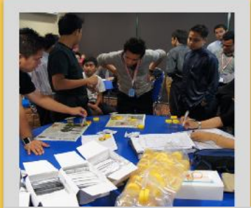
Antara sebahagian wargakerja yang menjalani ujian air kencing di Bilik VIP