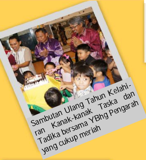
Sambutan Ulang Tahun Kelahiran Kanak-kanak Taska dan Tadika bersama YBhg Pengarah yang cukup meriah