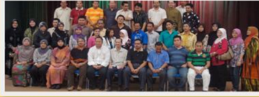
Jamuan Makan Malam bersama Yayasan Terengganu di Dewan Serbaguna PPPYS