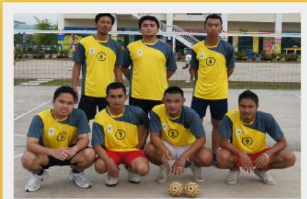
Antara wajah-wajah wira satria Yayasan Sarawak bagi perlawanan Sepak Takraw menentang MASJA