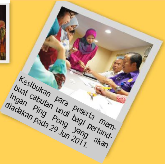
Kesibukan para peserta membuat cabutan undi bagi pertandingan Ping Pong yang akan diadakan pada 29 Jun 2011.