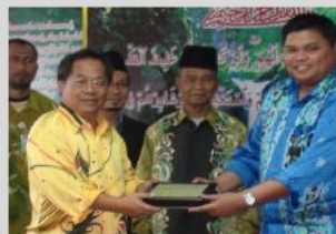
Lawatan APB 5S ke Jabatan Agama Islam Sarawak anjuran JK Latihan 5S Yayasan Sarawak pada 23 Jun 2011