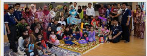
Ibu-bapa, guru-guru dan kanak-kanak Taska dan Tadika Yayasan Ku Sayang mengabadikan kenangan bersama YBhg Timbalan Pengarah di Majlis doa Selamat Ulangtahun Pertama Taska dan Tadika Yayasan Ku Sayang