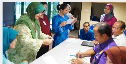
Sabar menunggu giliran...para peserta yang mengambil bahagian membuat cabutan undi di bilik VIP bagi pertandingan Ping Pong