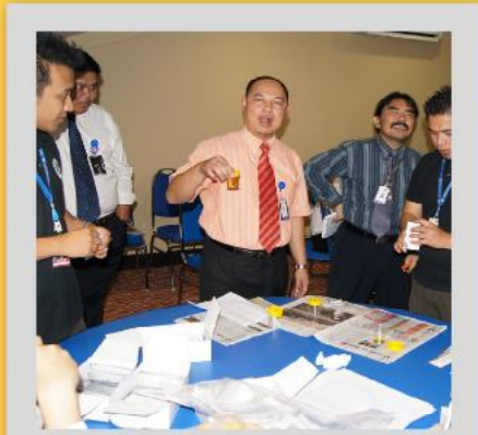
Aksi wargakerja yang menjalani ujian air kencing di PPPYS. Ujian air kencing telah dijalankan oleh Agensi Dadah Kebangsaan bagi meningkatkan kesedaran tentang bahayanya najis dadah.