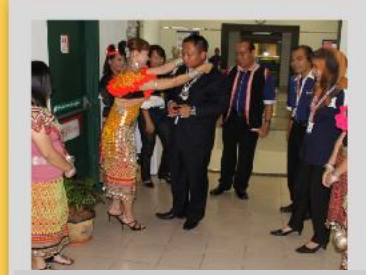
Salah seorang wargakerja menyurungkan rantai manik sebagai cenderahati kepada YBhg Pengarah semasa sambutan penutupan 'Hari Gawai Dayak' di Auditorium Yayasan Sarawak pada 28 Jun 2011.