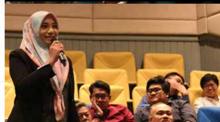
Sesi soal jawab telah dikemukakan kepada Pengarah Yayasan Sarawak oleh salah seorang delegasi.