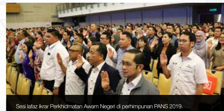
Sesi lafaz Ikrar Perkhidmatan Awam Negeri di perhimpunan PANS 2019.