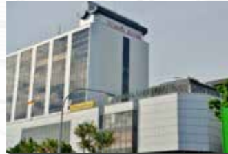
Wisma Satok, Jalan Satok, Kuching