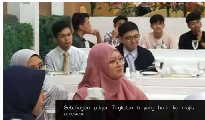
Sebahagian pelajar Tingkatan 5 yang hadir ke majlis apresiasi.