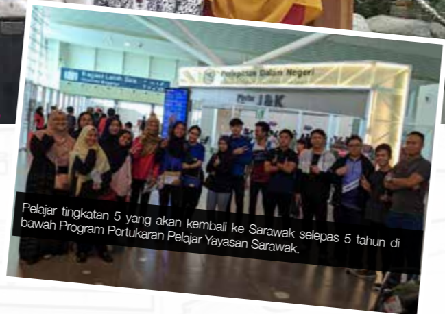
Pelajar tingkatan 5 yang akan kembali ke Sarawak selepas 5 tahun di bawah Program Pertukaran Pelajar Yayasan Sarawak.

KUALA LUMPUR, 30 November 2019 – Yayasan Sarawak menerusi Pejabat Kuala Lumpur (YSKL) telah menganjurkan Majlis Apresiasi Pelajar Tingkatan 5 Program Pertukaran Pelajar (Zon Semenanjung) bertempat di Hotel Royal Chulan, Kuala Lumpur bagi 15 orang pelajar tajaan Yayasan Sarawak yang telah menamatkan Tingkatan 5 dan tamat menduduki peperiksaan Sijil Pelajaran Malaysia (SPM) di Sekolah Berasrama Penuh (SBP) Semenanjung Malaysia.