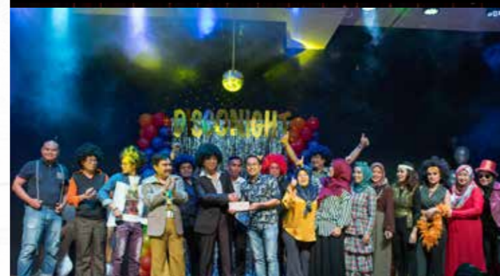
Juara Keseluruhan Kumpulan Hari Keluarga Yayasan Sarawak 2019 dinobatkan kepada Kumpulan Boney M.