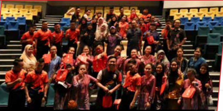
29/11/2019: Lawatan Majlis Perwakilan Pelajar Asrama SMK Oya, Mukah ke Wisma Adenan Yayasan Sarawak.