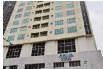
Ariva Gateway, Jalan Bukit Mata Kuching