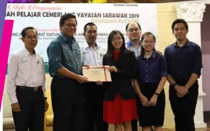
Salah seorang calon menerima sijil daripada YB Menteri Muda.