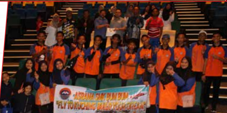
4/11/2019: Lawatan Pelajar & Guru SMK Bum-Bum Semporna, Sabah ke Wisma Adenan Yayasan Sarawak.