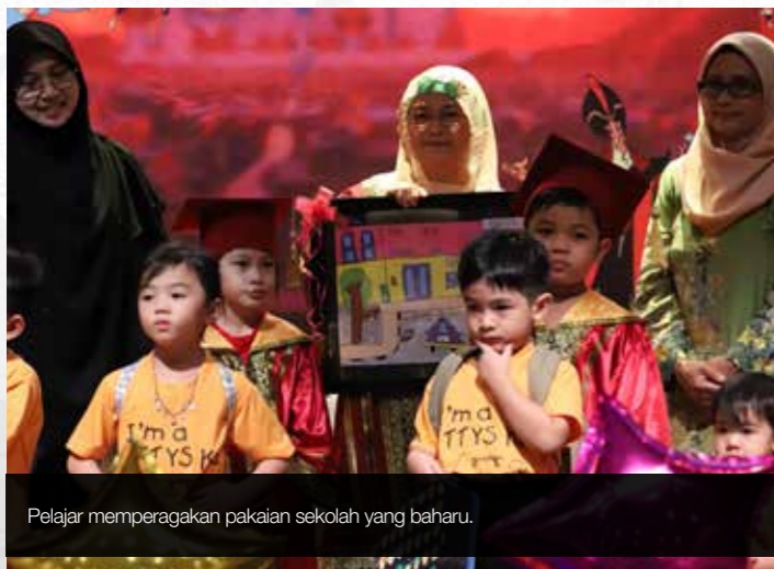
Pelajar memperagakan pakaian sekolah yang baharu.

Majlis meraikan seramai 25 orang graduan berusia 4 dan 6 tahun. Selain itu, beberapa orang kanak-kanak telah dianugerahkan hadiah galakan berdasarkan pencapaian luar jangka mereka dalam pelbagai bidang bagi tahun 2019.