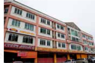
Demak Laut Commercial Centre, Kuching