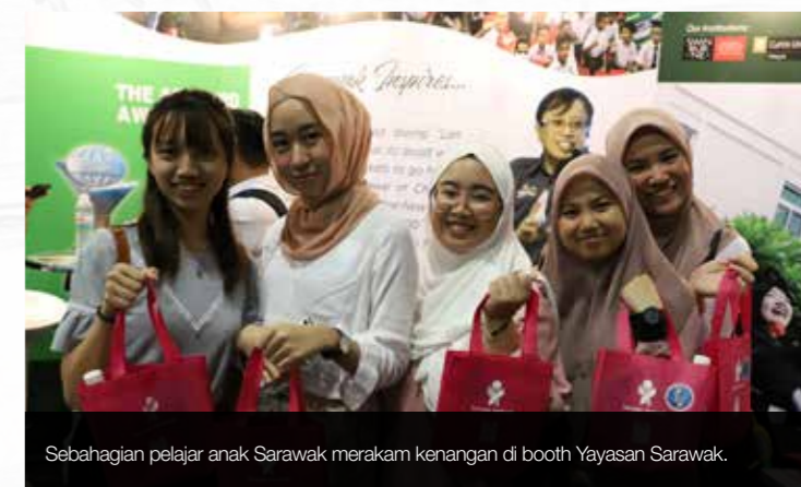
Sebahagian pelajar anak Sarawak merakam kenangan di booth Yayasan Sarawak.