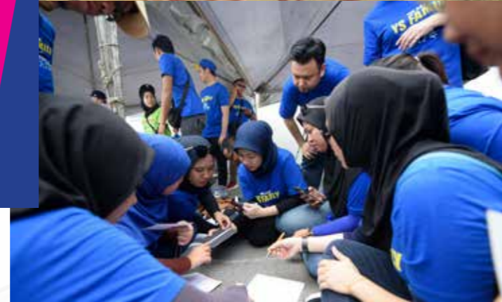
Salah sebuah kumpulan menjalankan aktiviti Team Building.

Aktiviti juga dimeriahkan dengan persembahan daripada setiap kumpulan yang terdiri daripada ABBA, Jackson 5, Black Dog Bone, Bee Gees dan Boney M. Terdapat beberapa kategori yang dipertandingkan seperti Juara Keseluruhan Team Building , Persembahan Kumpulan, dan Anugerah King & Queen serta Best Family .