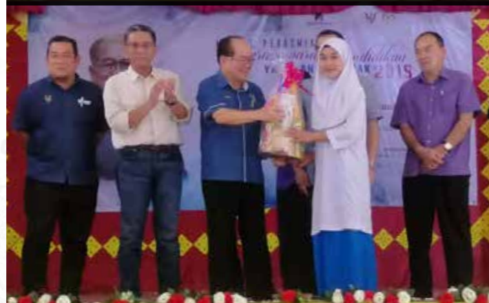
BETONG, 17.11.2019 - Salah seorang pelajar menerima hadiah daripada YB Timbalan Ketua Menteri.