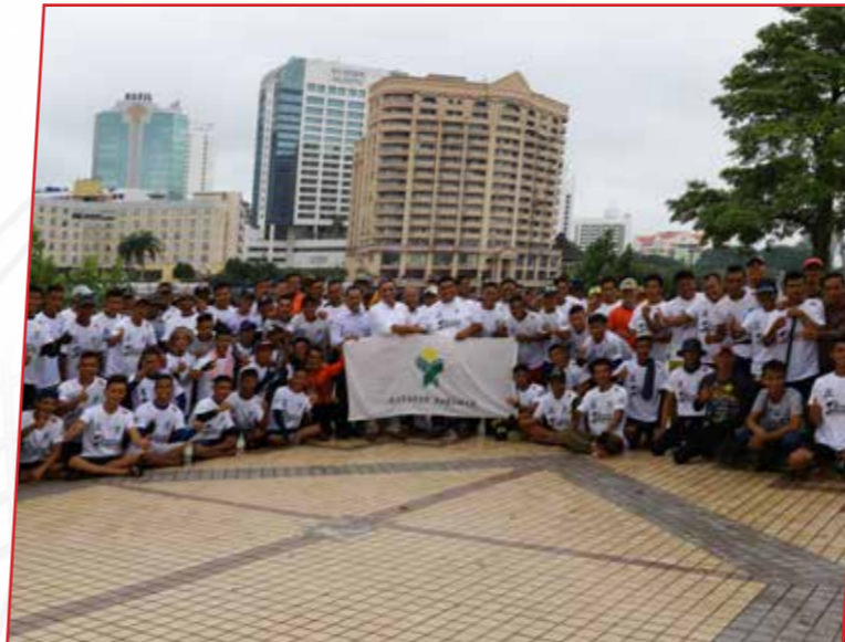
31/10/2019: Sesi penyerahan bendera kepada pasukan Regatta Sarawak 2019 Yayasan Sarawak-Puteri Dang Balai di Pengkalan Gersik, Petra Jaya, Kuching.