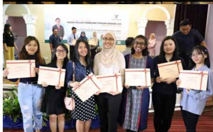
Pelajar cemerlang yang menerima sijil turut merakam kenangan bersama.