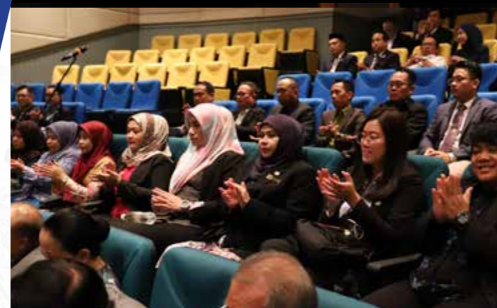
Sebahagian daripada delegasi yang hadir ke sesi taklimat.