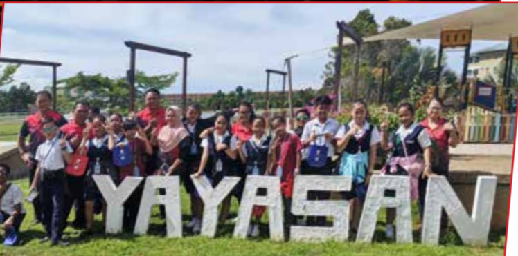
25/11/2019: Lawatan Pengawas & Guru SK Rantau Dilang, Kanowit ke Wisma Adenan Yayasan Sarawak.