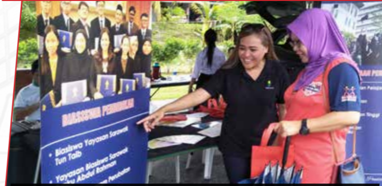
29/11/- 1/12/2019: Pameran Agensi Sempena Pesta Tasik Biru Perkarangan Tasik Biru, Bau.