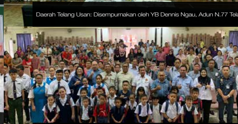
Daerah Kanowit: Disempurnakan serentak oleh seorang Ahli Parlimen dan tiga (3) orang ADUN kawasan pada 20 September 2019 di Dewan Pejabat Daerah Kanowit, Sibul.