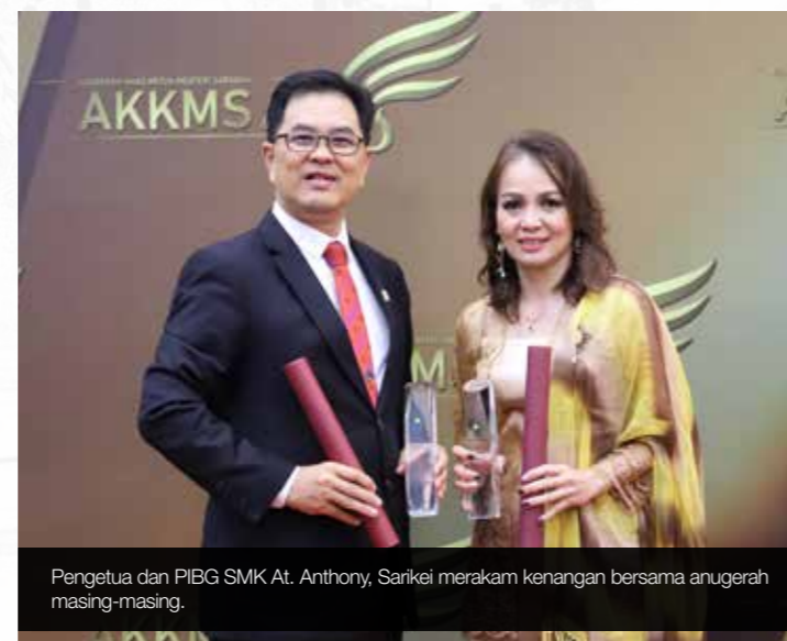
Pengetua dan PIBG SMK At. Anthony, Sarikei merakam kenangan bersama anugerah masing-masing.