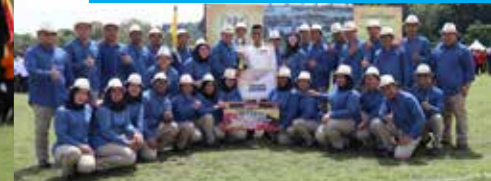
Ahli kontinjen merakam kenangan bersama dengan Pengarah Yayasan Sarawak.