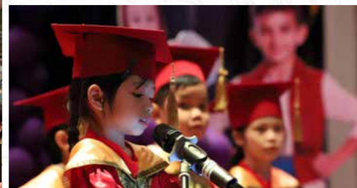
Seorang wakil pelajar memberi ucapan terima kasih kepada cikgu, pengurusan dan hadirin.