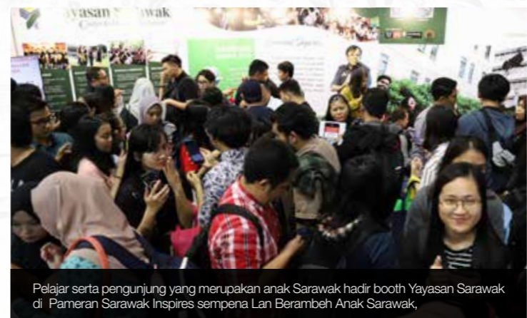
Pelajar serta pengunjung yang merupakan anak Sarawak hadir booth Yayasan Sarawak di Pameran Sarawak Inspires sempena Lan Berambéh Anak Sarawak.

Bertemakan 'Kamek Sayang Sarawak', 'Lan Berambéh Anak Sarawak 2019' menyediakan 70 ruang pameran yang dibuka dari jam 9 pagi hingga 9 malam, dengan 34 daripadanya melibatkan kementerian, persatuan dan juga kaunter perkhidmatan.