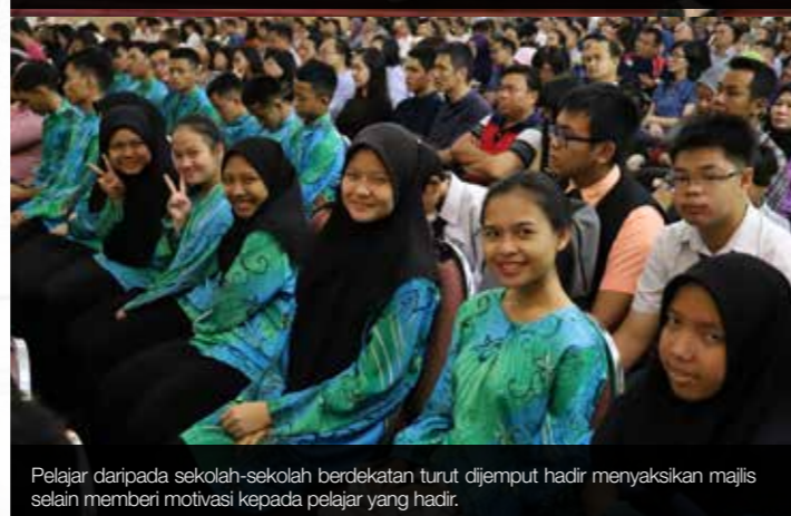
Pelajar daripada sekolah-sekolah berdekatan turut dijemput hadir menyaksikan majlis selain memberi motivasi kepada pelajar yang hadir.