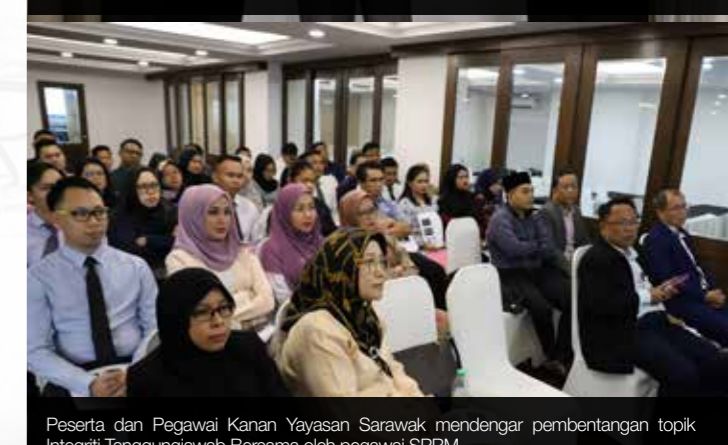
Peserta dan Pegawai Kanan Yayasan Sarawak mendengar pembentangan topik Integriti Tanggungjawab Bersama oleh pegawai SPRM