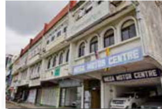
Jalan Rock, Batu Lintang Kuching