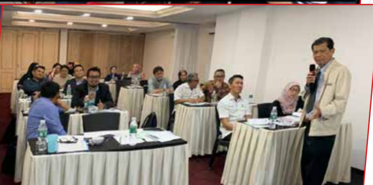
24-25/10/2019: Kursus warga kerja bagi Audit Dalam MS ISO 9001-2015 di Serapi Hotel, Kuching.