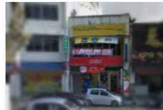
Jalan Padungan, Kuching