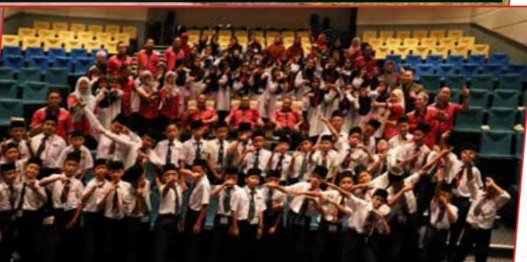
20/9/2019: Lawatan Guru & Pelajar SK Abang Leman, Kabong ke Wisma Adenan Yayasan Sarawak.