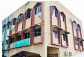
Jalan Pinang Jawa, Gita Kuching