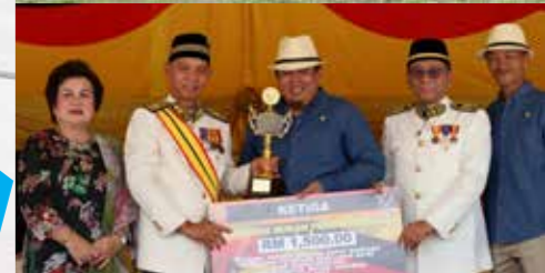
Pengarah dan Ketua Kontinjen Yayasan Sarawak terima hadiah tempat ketiga Kategori Bukan Penguatkuasa.

MIRI, 8-12 Oktober 2019 - Pada tahun ini Yayasan Sarawak turut menyertai ke Acara Istiadat Perbarisan dan Rapat Raksasa bersempena