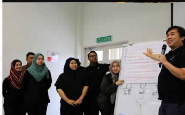
Salah sebuah kumpulan yang membentangkan cadangan penyelesaian masalah mereka.