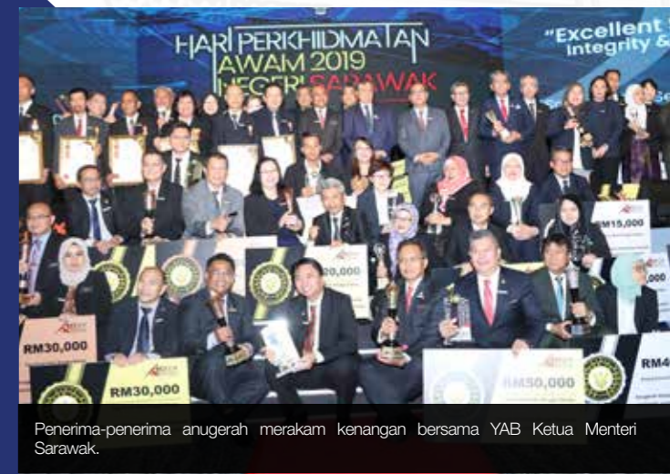
Penerima-penerima anugerah merakam kenangan bersama YAB Ketua Menteri Sarawak.

Kejayaan ini merupakan yang kedua buat Yayasan Sarawak setelah pertama kali memenangnya pada tahun 2000 yang lalu.