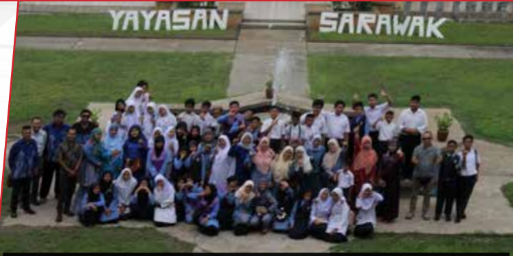
18/10/2019: Lawatan Guru & Pelajar SK Abang Man ke Wisma Adenan Yayasan Sarawak.