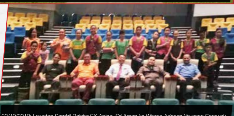
22/10/2019: Lawatan Sambil Belajar SK Aping, Sri Aman ke Wisma Adenan Yayasan Sarawak.