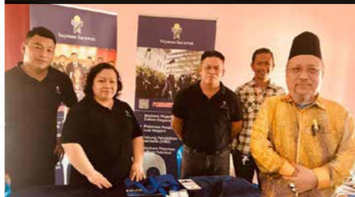
BETONG, 17.11.2019 - Petugas pameran Yayasan Sarawak merakam kenangan bersama penceramah motivasi jemputan.