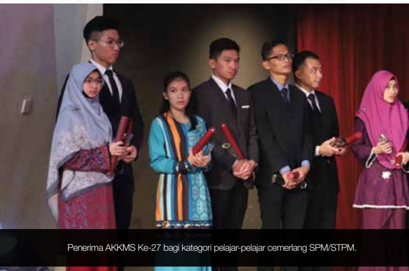
Penerima AKKMS Ke-27 bagi kategori pelajar-pelajar cemerlang SPM/STPM.

Setiap penerima anugerah membawa pulang sijil penghargaan, trofi dan juga wang tunai.