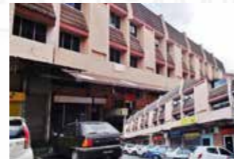
Tabuan Jaya, Kuching