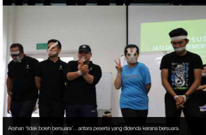
Arahan 'tidak boleh bersuara'... antara peserta yang didenda kerana bersuara.