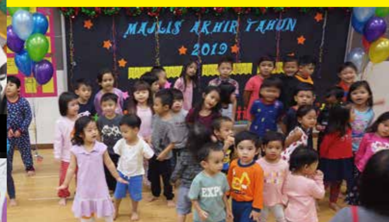
Kanak-kanak TTYS membuat persembahan bagi meraikan tetamu yang hadir.