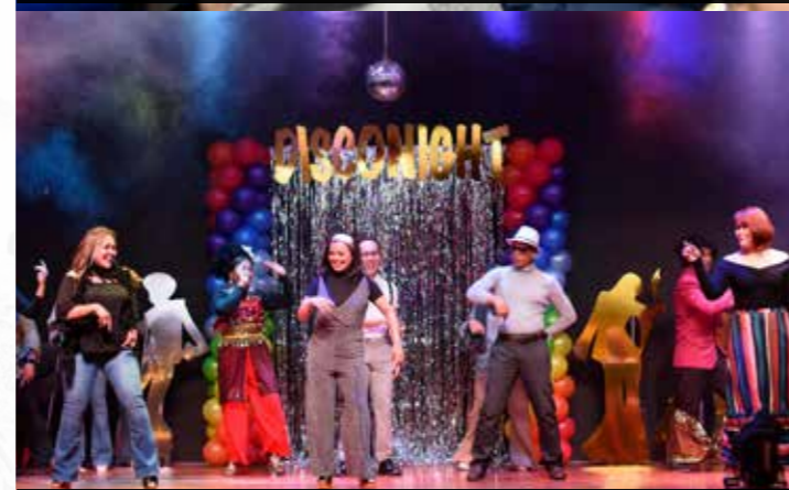
Kumpulan ABBA dinobatkan sebagai Juara Kategori Persembahan Kumpulan.