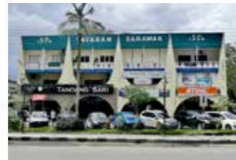
Jalan Club, Sri Aman