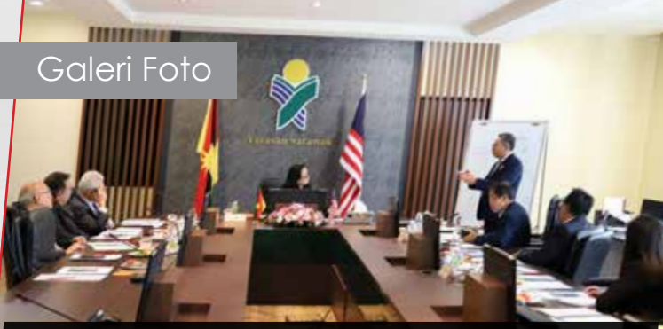
20/11/2019: Mesyuarat Jawatankuasa Pendidikan Ke-70 di Wisma Adenan Yayasan Sarawak.