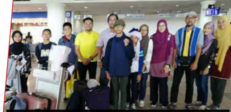
23-25/11/2019: Pelajar Program Pertukaran Zon Semenanjung balik ke destinasi masing-masing di Sarawak.