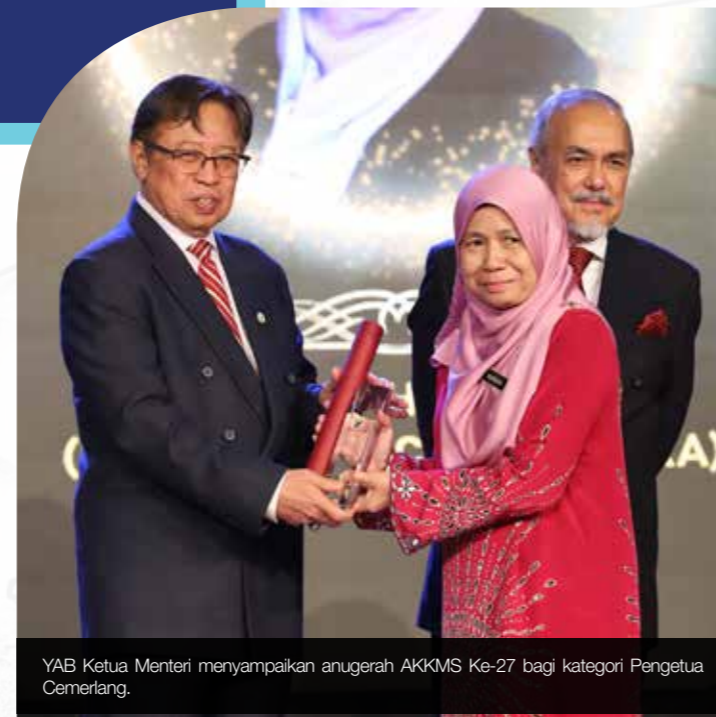
YAB Ketua Menteri menyampaikan anugerah AKKMS Ke-27 bagi kategori Pengetua Cemerlang.