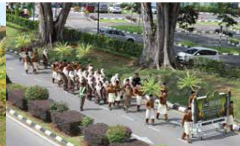
Pengarah dan Ketua Kontinjen Yayasan Sarawak terima hadiah tempat ketiga Kategori Bukan Penguatkuasa.

Walaupun tidak mendapat sebarang tempat, Kontinjen Yayasan Sarawak tetap bersemangat meraikan perayaan junjungan besar kita tersebut .