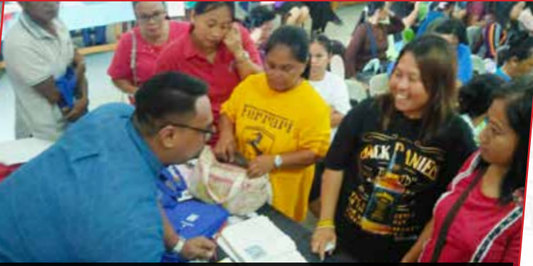
16 & 24/10/2019: Yayasan Sarawak turut serta Pameran Program Intervensi Sosial Bahagian Kuching & Bahagian Kapit