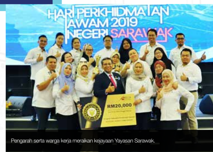
Pengarah serta warga kerja merakam kejayaan Yayasan Sarawak.