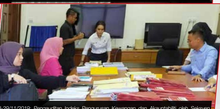
28-29/11/2019: Pengauditan Indeks Pengurusan Kewangan dan Akauntabiliti oleh Seksyen Audit & Pengurusan Risiko di pejabat Kuala Lumpur.