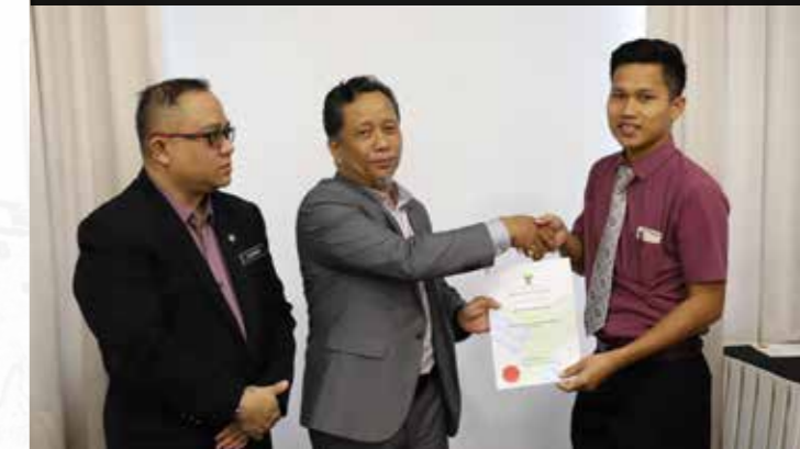
Peserta menerima Sijil Penyertaan daripada Timbalan Pengarah