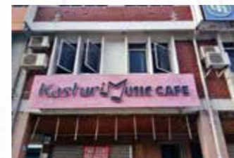
Jalan Sommerville, Bintulu