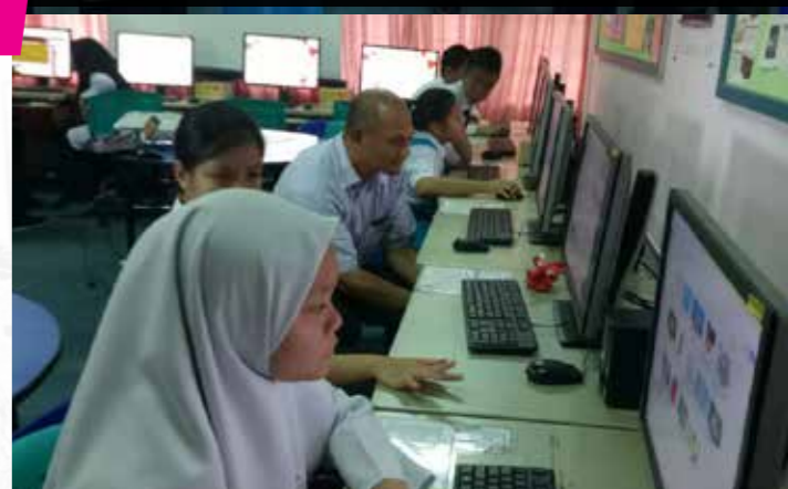
Pelajar dan guru sedang menggunakan komputer.