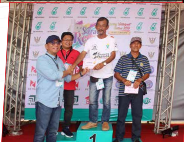
2-3/11/2019: Pasukan Regatta Sarawak 2019 Yayasan Sarawak-Puteri Dang Balai.