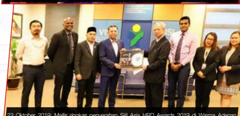
23 Oktober 2019: Majlis ringkas penyerahan Sijil Asia HRD Awards 2019 di Wisma Adenan Yayasan Sarawak.