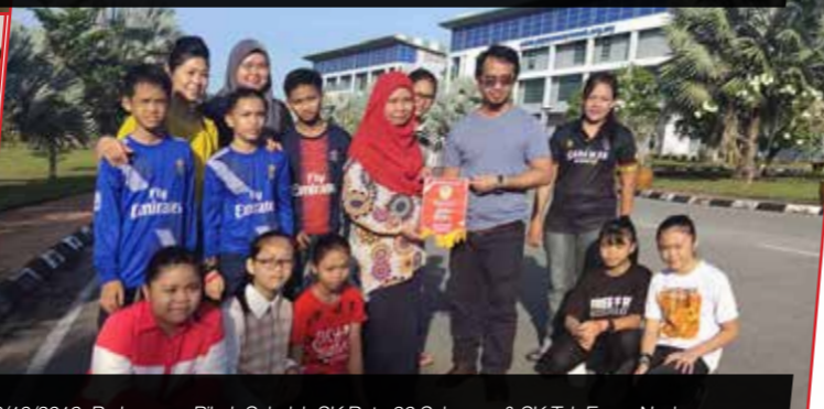
16/10/2019: Perhargaan Pinak Sekolah SK Batu 36 Selangau & SK Tok Eman Nyabor.