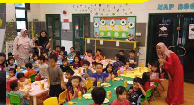
Cikgu TTYS merakam kenangan bersama-sama dengan pelajar.

WISMA ADENAN, 20 Disember 2019 - Majlis Akhir Tahun Taska Tadika Yayasanku Sayang telah diadakan pada 20 Disember 2019 bertempat di Taska Tadika Yayasanku Sayang.