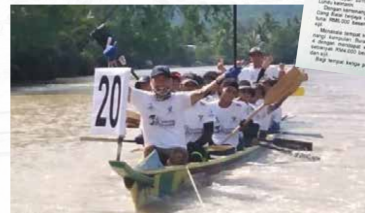
Pengayuh YS-PDB merakamkan meraikan saat kemenangan.