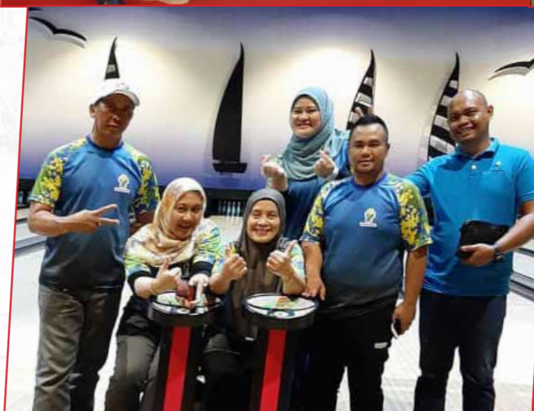
26/10/2019: Kelab Yayasan Sarawak turut serta ke DBNA 10 Pin Bowling Tournament di Megalanes Sarawak.