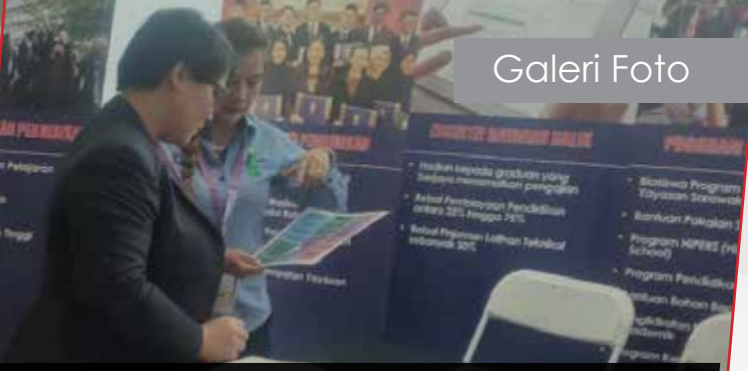
22-23/10/2019: Pameran Konferens Psikologi & Kaunseling Perkhidmatan Awam Negeri Sarawak (PANS) Kali Ke-5 di Hotel Pullman, Kuching.