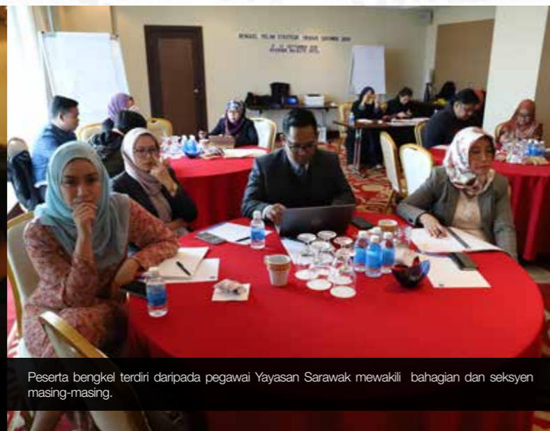
Peserta bengkel terdiri daripada pegawai Yayasan Sarawak mewakili bahagian dan seksyen masing-masing.