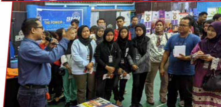
7 & 14/12/2019: Yayasan Sarawak turut serta Pameran Roadshow Digital Inclusivity di Sri Aman & Meradong