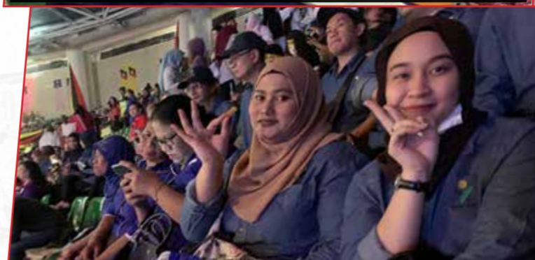
16/9/2019: Sambutan Perhimpunan Hari Malaysia di Borneo Convention Centre Kuching (BCCK).