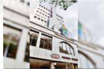
Yayasan Sarawak Building, Jalan Masjid, Kuching