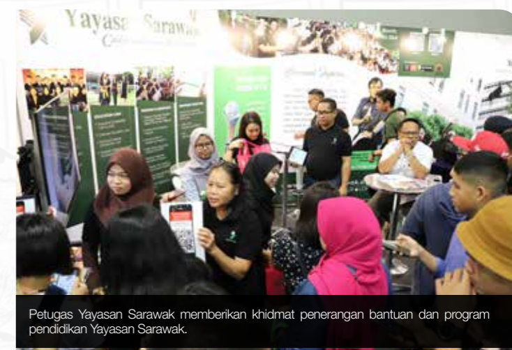
Petugas Yayasan Sarawak memberikan khidmat penerangan bantuan dan program pendidikan Yayasan Sarawak.

Ruang pameran Yayasan Sarawak telah dikunjungi sekitar 10,000 pelajar dan para ibu bapa bagi mendapatkan khidmat penerangan daripada pegawai yang bertugas.