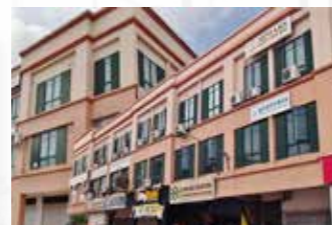
Jalan Bulatan Piasau, Miri