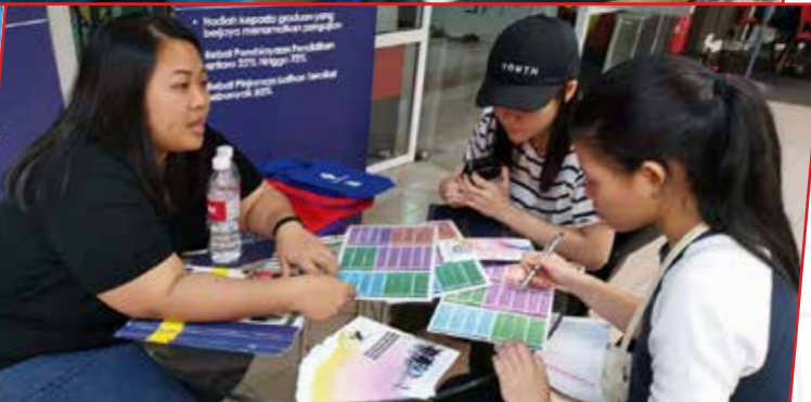
30/11/2019: Pameran Swinburne University Open Day di Student Leisure Area (Lobby Block B), Swinburne Sarawak Campus.