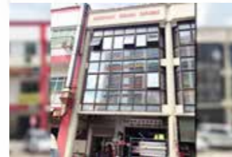
Jalan Bangkita, Limbang