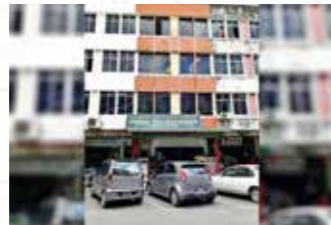
Jalan Airport Lama, Kapit