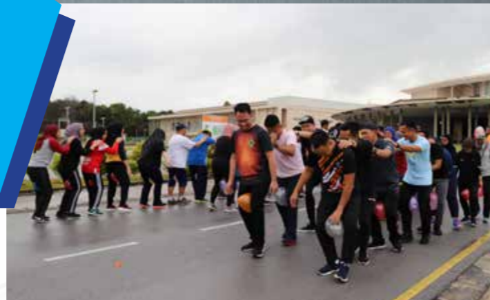
Kesepakatan dan kerjasama bagi memastikan sasaran dicapai bersama

Selain itu, para peserta telah terlibat dalam banyak aktiviti indoor dan outdoor sepanjang menghadiri program tiga (3) hari tersebut.