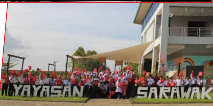
2/11/2019: Lawatan Sambil Belajar SK Tuanku Bagus, Sebuyau ke Wisma Adenan Yayasan Sarawak.