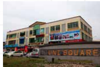
Unisquare, Kota Samarahan