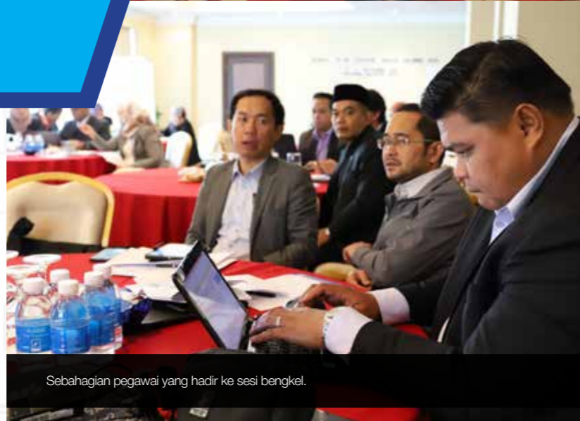
Sebahagian pegawai yang hadir ke sesi bengkel.

Bengkel ini juga mengambil kira polisi-polisi serta program-program baru yang akan dilaksanakan dalam tempoh lima (5) tahun akan datang.