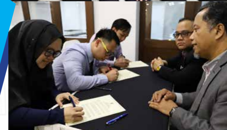
Peserta menandatangani Akuan/Ikrar Kerahsiaan di hadapan Timbalan Pengarah Yayasan Sarawak